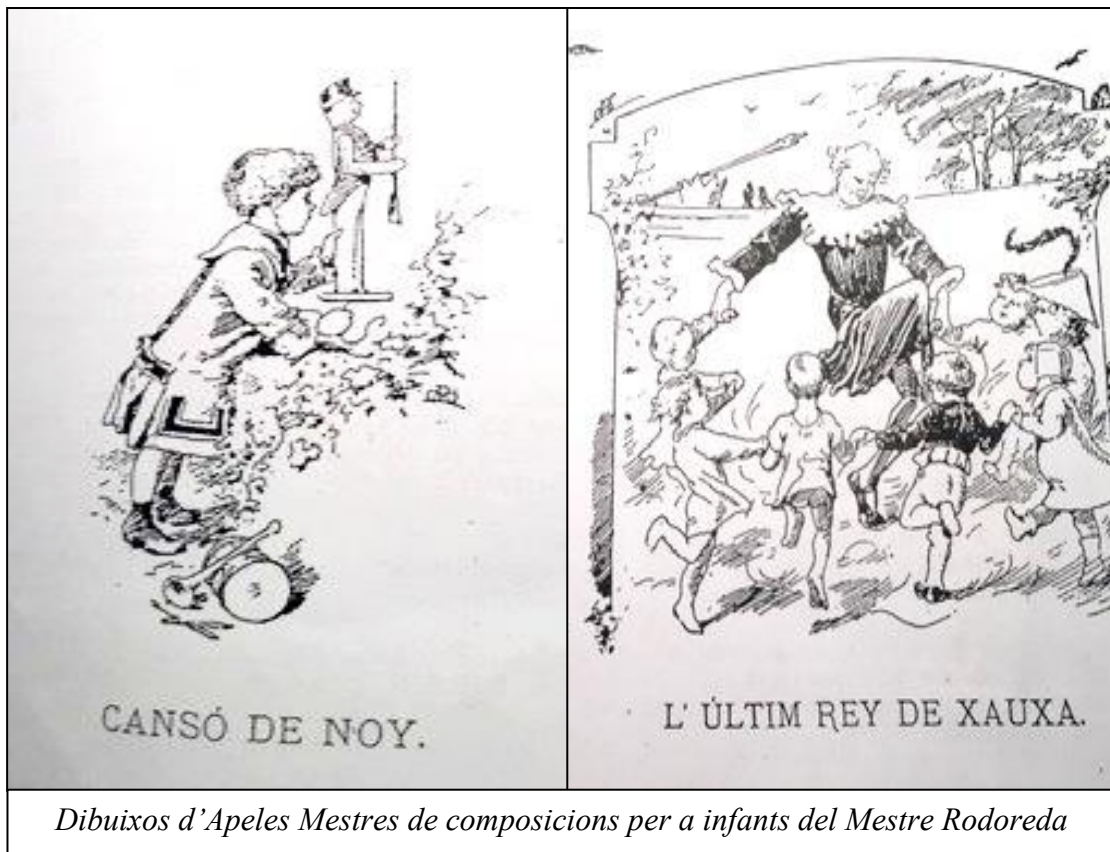
Dibuixos d'Apeles Mestres de composicions per a infants del Mestre Rodoreda

“...nosaltres que a més de quatre judicar severíssimament les creacions de Wagner, i despressiar ab amarga ironia i escudats en lo mantell de “eminències” no sols sas obres, sinó fins sos partidaris ansiaven que una audició perfecta i seria nos vindiqués, i demostres als qui tan alta portaven la bandera de la ignorància i de la oposició sense fonament i per sistema, que no convé oblidar aquell antic i filosòfic refrà de nostra terra: “Qui de roba d’altre es vesteix al mig del carrer el despullen”