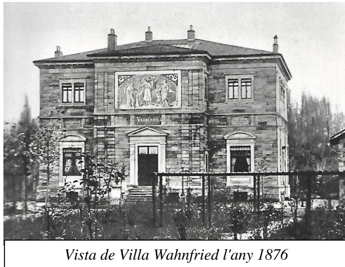
Vista de Villa Wahnfried l'any 1876

– El seu desig d'establir un lloc adequat per representar els seus Drames, i que estigui separat de la vida teatral de la gran ciutat, va portar a Wagner a interessar-se per l'Òpera de Bayreuth. Després de visitar-la el 16 d'abril de 1871 , va jutjar que la sala no li convenia. El desembre d'aquell mateix any tornà a Bayreuth per analitzar altres terrenys i després de diversos dubtes n'acceptà uns per teatre ell mateix.