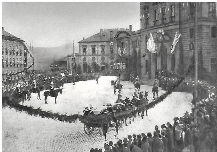
Arribada de l'Emperador Guillem I a Bayreuth

* L'Emperador Guillem I arriba amb tota la pompa, en un carruatge descobert. Assisteix però, a les dues primeres sessions del cicle.