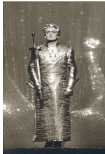
Sandor Konya, Lohengrin

Associació Wagneriana. Apartat postal 1159. Barcelona 08080