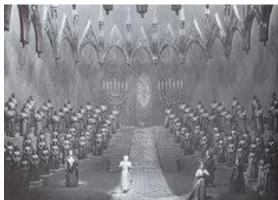
Lohengrin , Acte III

Associació Wagneriana. Apartat postal 1159. Barcelona 08080