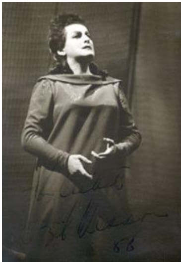
Birgit Nilsson, Isolde.

Nou Bayreuth; la primera, del 1952, es devia al seu germà Wieland. Wolfgang, a diferència del seu germà, no buscava sorprendre o provocar, ans al contrari; les seves produccions, tot i que integrades en la nova estètica dels Festivals, mai van ser trencadores; a més, mai va fer experiments amb els cantants. Això no vol dir que fos un reaccionari, ni molt menys. La parella protagonista d'aquest Tristan la formaven Wolfgang Windgassen i Birgit Nilsson; el tenor, imprescindible des de la reobertura al 1951, cantava aquest paper per primera vegada a Bayreuth; la soprano també s'estrenava amb la part i consolidava una presència a Bayreuth que havia començat de forma intermitent; fins ara només havia cantat la IX simfonia al 53 i Elsa i Ortlinde al 54. Tot i ser de la mateixa generació que Astrid Varnay, Birgit Nilsson havia assolit la fama internacional molt més tard. Aquell any 1957 cantaria a Bayreuth, a més d'Isolde, Sieglinde i la 3 Norn. El repartiment el completaven Arnold van Mill (Marke), Grace Hofmann (Brangäne), Fritz Uhl (Melot); Hans Hotter i Gustav Neidlinger van cantar cada un tres de les sis funcions en el paper de Kurwenal.