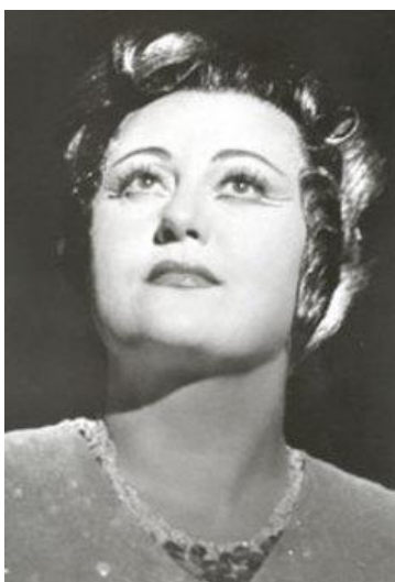
Regine Crespin, Kundry

El Ring comptava també amb un repartiment ple de novetats: respecte al 1957, canviaven els intèrprets de Donner, Froh, Loge, Fricka, Alberich, Fasolt, Wellgunde, Flosshilde, Siegmund, Sieglinde, Gunther, Waltraute, les tres Nornes, cinc Valquíries i l'Ocell del bosc. Només repetien algun comprimari, Elisabeth Grümmer, com a Freia i Guttrune (des del 1957) i els cinc puntals del Ring de Wieland i de tot el Nou Bayreuth: Astrid Varnay, Martha Mödl, Wolfgang Windgassen, Hans Hotter i Josef Greindl. Varnay i Mödl eren Brünnhilde; l'una, des del primer Festival de 1951; l'altra, des del 1953; a partir d'aquell any, cada una cantava un dels dos cicles del Ring . Windgassen seguia sent Siegfried, paper que cantava des del Festival del 1953. Un any abans, al 1952, s'havien incorporat a l'equip Hans Hotter i Josef Greindl; l'un com a Wotan; l'altre, com a Fafner, Hunding i Hagen, papers que havien interpretat al llarg dels anteriors Festivals fins a aquest darrer de 1958.