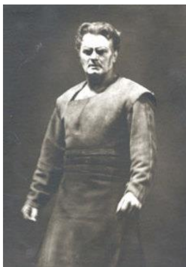
Jon Vickers, Siegmund