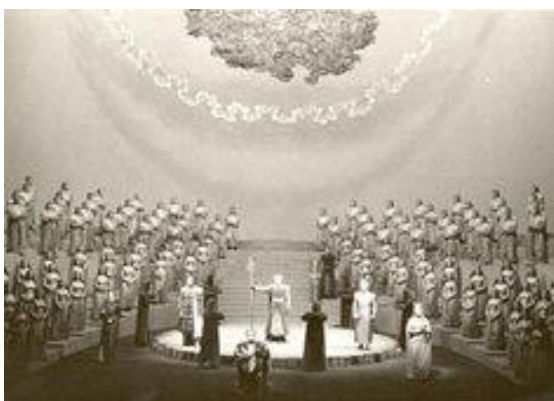
Lohengrin , Acte I

Estan editades en CD totes les obres d'aquell Festival de 1958: Lohengrin (Myto), Tristan und Isolde (Walhall), Die Meistersinger von Nürnberg (Andromeda, amb Josef Traxel com a Walther von Stolzing), Parsifal (Andromeda) i Der Ring des Nibelungen (Arkadia, Melodram). Aquest Ring està editat en CD per Walhall amb les quatre obres per separat. Les edicions d'Arkadia, en quatre caps de plàstic, com la de Melodram, en una sola caixeta de cartró, estan descatalogades i són pràcticament impossibles de trobar; la primera edició d'aquest Ring en LP la va fer Melodram en quatre àlbums de color daurat; això va per als buscadors de tresors.