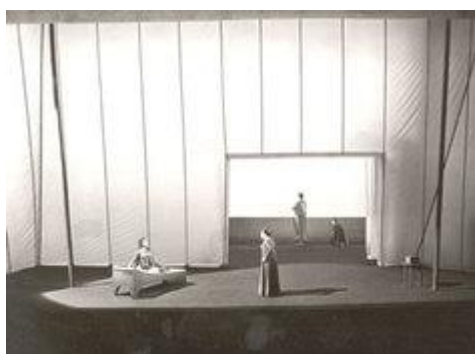
Tristan und Isolde, acte I

La nova producció de Tristan und Isolde no va despertar l'animadversió que havien despertat les altres noves produccions del Nou Bayreuth. És sabut que, de totes les obres de Wagner, Tristan und Isolde és la més fàcil de muntar des del punt de vista escènic, atès que els quadres són estàtics i amb poca presència de cantants sobre l'escenari.