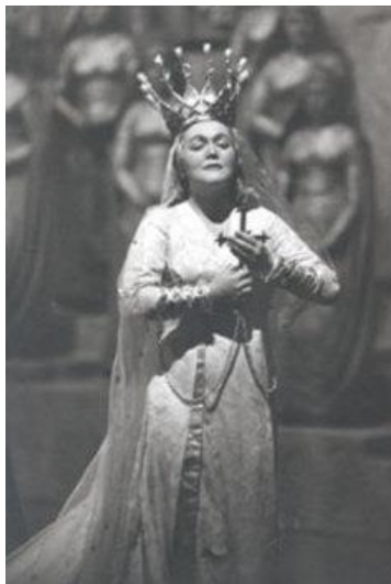
Leonie Rysanek, Elsa

Entre els nous fixos cal destacar Hans Beirer, que cantaria a Bayreuth Parsifal, Tristan i Tannhäuser fins al 1962; la seva partenaire Regine Crespin, que seria Kundry, Sieglinde i 3.Norn fins al 1961; llur company a Parsifal Jerome Hines, que hi cantaria Gurnemanz, Marke i Wotan fins al 1963; i el darrer de l'equip parsifalià, Eberhard Waechter, que apareixeria per darrera vegada a Bayreuth al 1966 amb el mateix Amfortas de 1958; en l'interim, Der Heerrufer des Königs, Fritz Kothner, Kurwenal i Wolfram von Eschenbach.